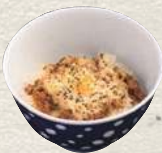
② 焼きチーズ キーマカレー丼