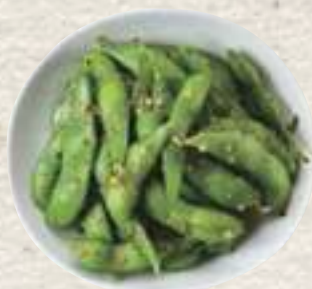
②枝豆ペペロンチーノ