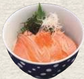
① 炙りサーモンといくら丼