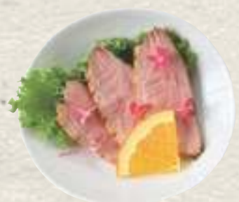
④鴨ロース オレンジソース