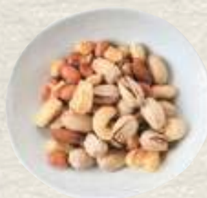
③ピスタチオMixナッツ