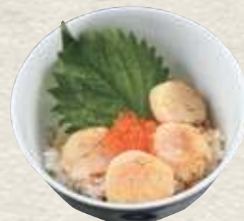
⑦ 炙り帆立の バター焼き丼