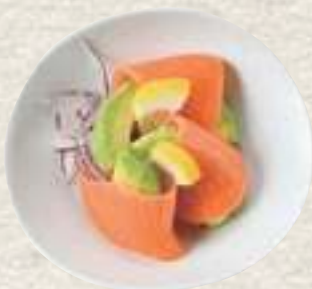
①サーモンアボカドの 和風カルパッチョ

ビール は本日のクラフトビール2種類のうちどちらか 1種類 、 おつまみ は下記からお好きな物 1種類 をお選びいただけます。