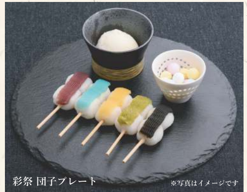
彩祭 団子プレート