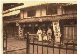
明治末期の中川誠盛堂本店

安政五年(1858年)の創業以来、限りなく自然に近い製法を貫き、土作りから製茶にいたるまで丹精込めた茶作りに励んでいる茶舗です。 中川誠盛堂の近江茶は格別の風味をもった銘茶の最高峰として、広く全国の愛飲家に親しまれています。